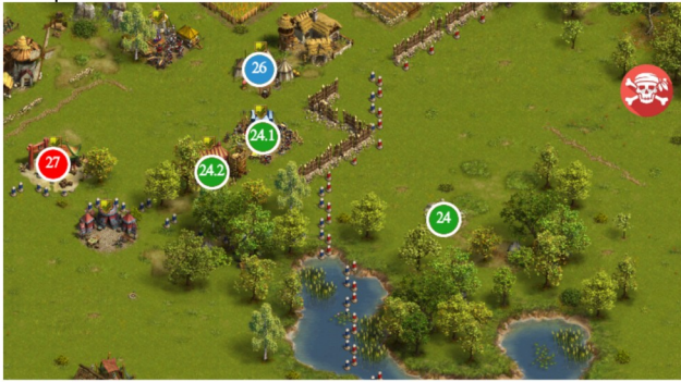
Camp 26 – 27

#26 GT 48C 150E ( risque d'interception – viser le chef #27 ) #27 ANS 65R 100K