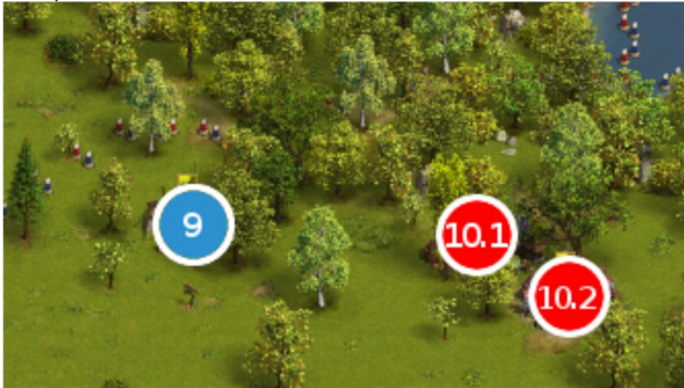
Camp 9 - 10

#9 GT 163E ( viser le chef pas le camp à bloquer ) #10 V1 : GemJ 1R V2 : GEM 90R 120C 85Xb