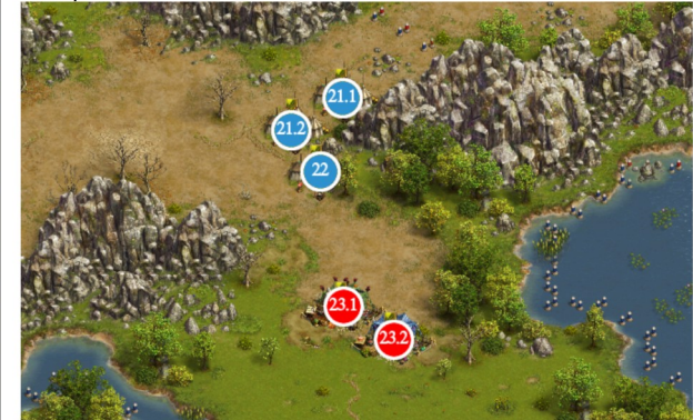
Camp 21 - 23

#21 V1 : GT 1R V2 : GT+ 23C 192E #22 GT+ 215E #23 V1 : GemJ 155R V2 : GEM 120R 80C 95K