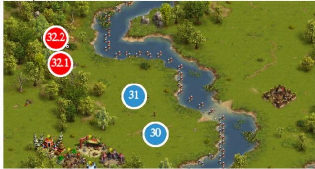
Camp 30 - 32

#30 GT 5C 130E #31 GT 125E #32 V1 : NUS 1R V2 : GEM 120R 60C 115K