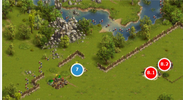
Camp 7 - 8

#7 GT 191E #8 V1 : NUS 50Ac V2 : GEM 140R 20C 135Xb