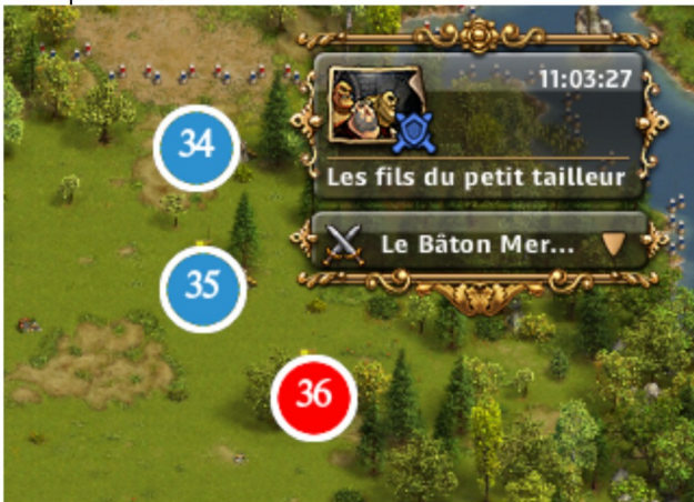
Camp 34 - 36

#34 GT 71C 121E #35 GT 175E #36 GEM 140R 155K