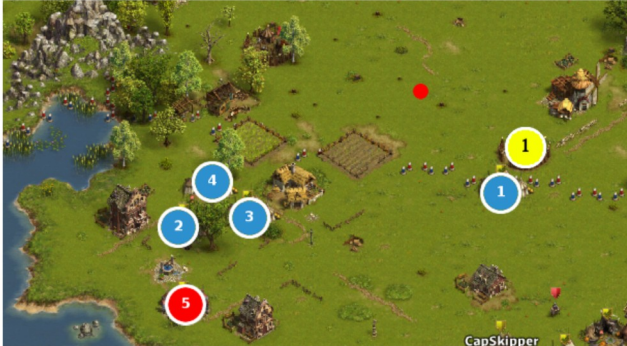
Camp 1 - 5

#2 GT 61C 137E #4 GT 103C 84E #1 GT+ 26E 188C #3 GT 145R 5C 48E #5 GEM 200R 95K