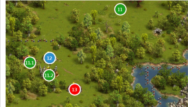
Camp 12 - 13

#9 GT 163E ( viser le chef pas le camp à bloquer ) #10 V1 : GemJ 1R V2 : GEM 90R 120C 85Xb