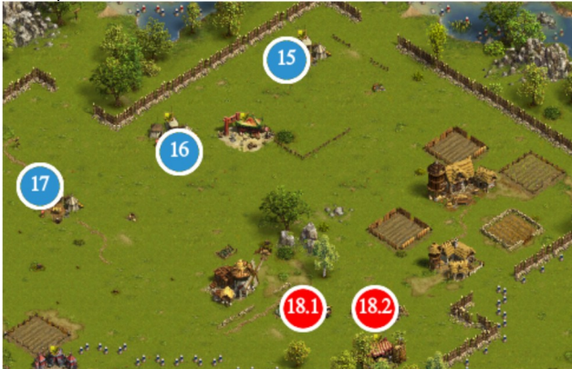
Camp 15 - 18

#15 GT+ 204E 8K #16 GT 128E 60C #17 GT+ 128E 86C #18 V1 : GemJ 1R V2 : GEM 164R 80C 51Xb